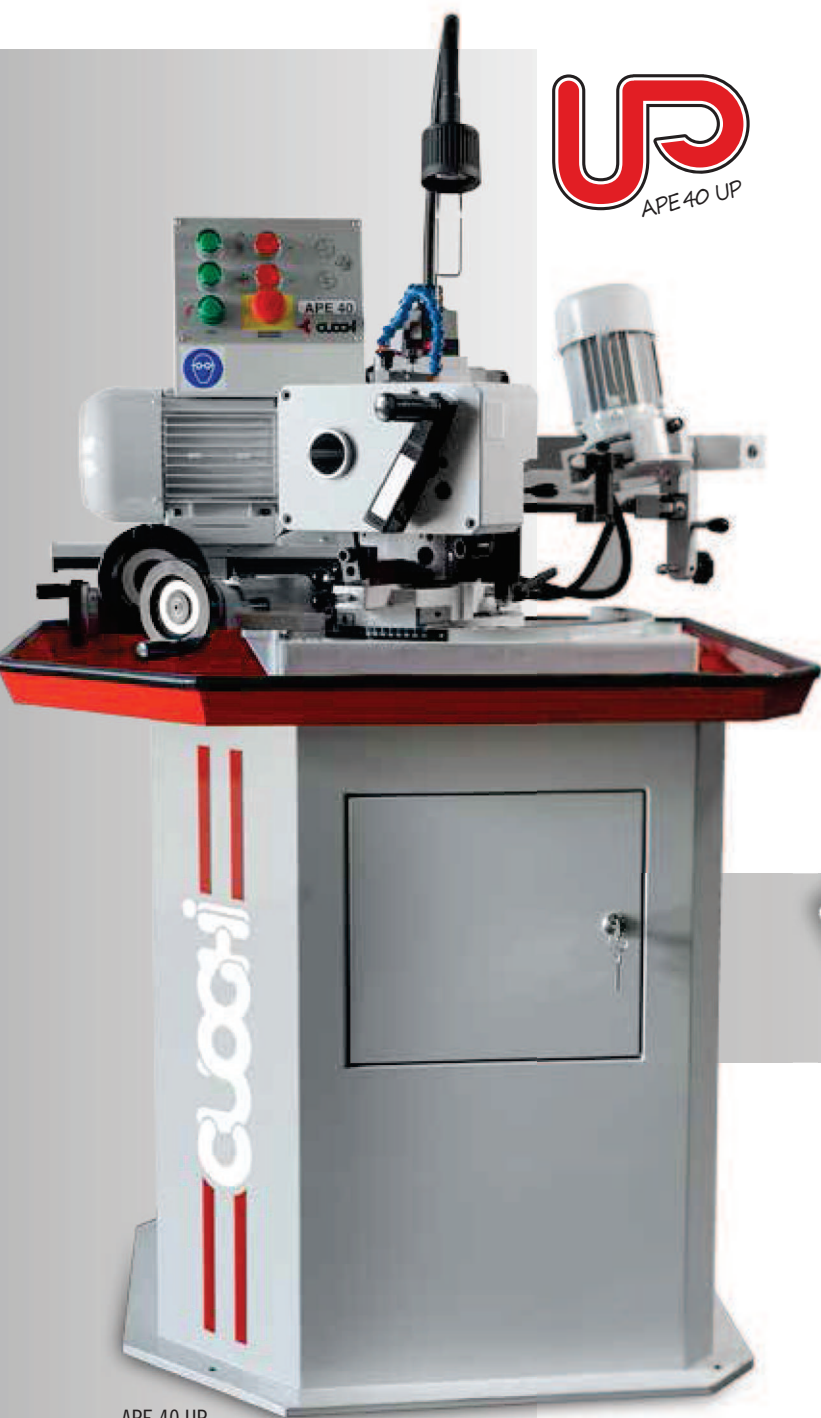
APE 40 UP